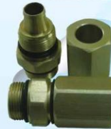
F31: FEED THRU FOR RG-11 (ข้อต่อ RG-11 เกลียวนอก /2 ชั้น)