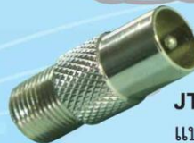
JTV 03: JACK TV3 ตัวผู้, แบบหมุน (เกลียวนอก), เหล็ก, อย่างดี