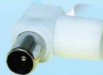
JTV 01: JACK TV1 ตัวผู้, แบบพลาสติก, ตัวงอ