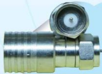
F15-1: RG-11 CONNECTOR, แบบบีบ, PIN( หัวต่อ RG-11