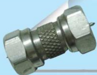
F20: MALE TO MALE CONNECTER (ข้อต่อ ตัวผู้ 2 ข้าง)