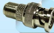
F73: BNC Connector