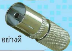
SKC 09: JACK TV ตัวเมีย, แบบหมุน (เกลียวใน), เหล็ก, อย่างดี