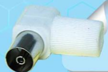
SKC 10: JACK TV ตัวเมีย, พลาสติก, ตัวงอ